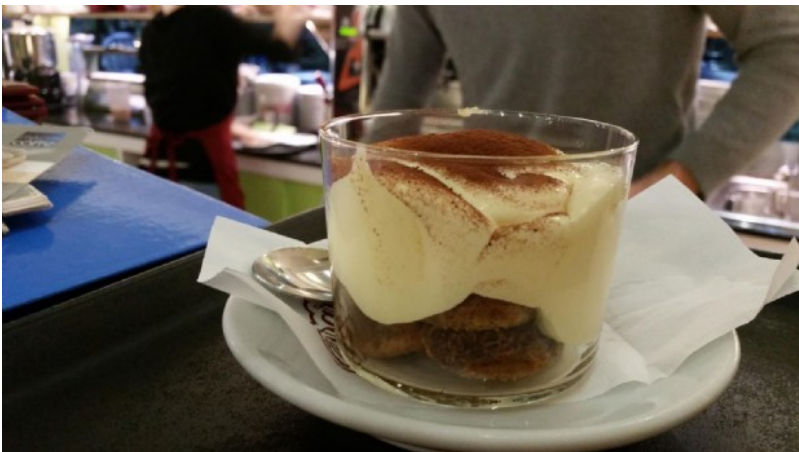
Il tiramisù di MEESOO®

Tutto su: Alimentazione Tecnologia Innovazione Cucina Startup Università Bocconi Milano